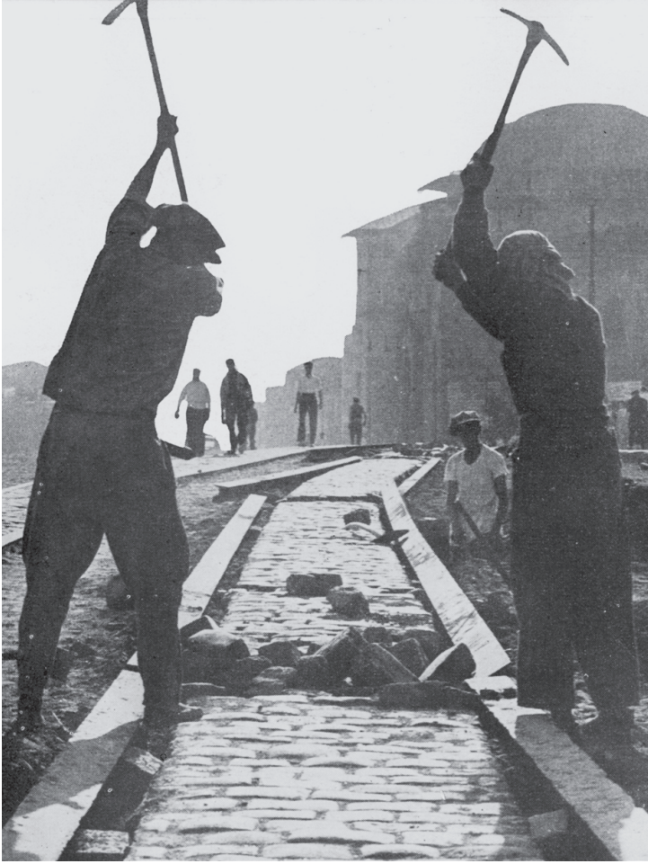
Beyazıt Meydanı'nda, Ordu Caddesi'nin başladığı ilk kısımdan itibaren tramvay raylarının kaldırılışı ve beton-asfalt yola ait ilk hazırlık çalışmaları, 1950'ler.