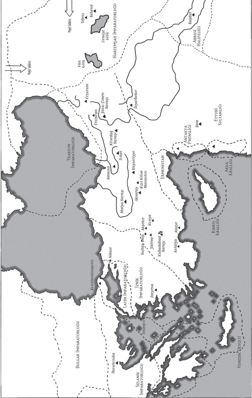
DIYARJ RUMI (1230-1243)